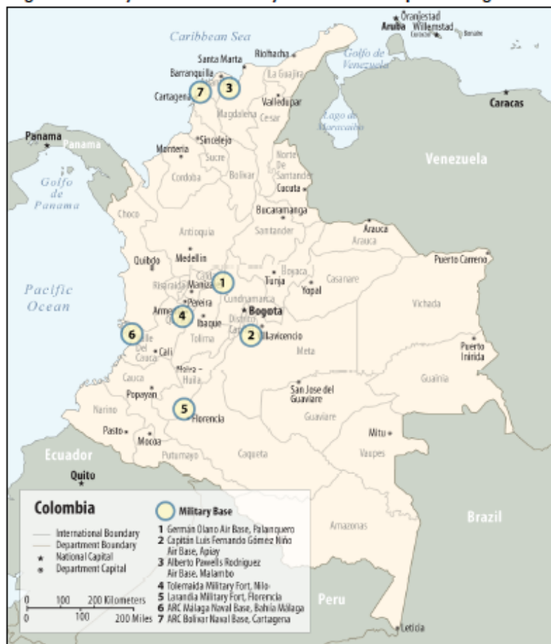
Figure 2. Military Bases Addressed by the Defense Cooperation Agreement